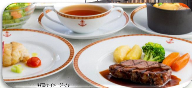
料理はイメージです

三島由紀夫の小説「金閣寺」にも登場するこの寺は、多くの重要文化財を保有し、四季折々の情景が楽しめる場所として地域住民からも親しまれています。