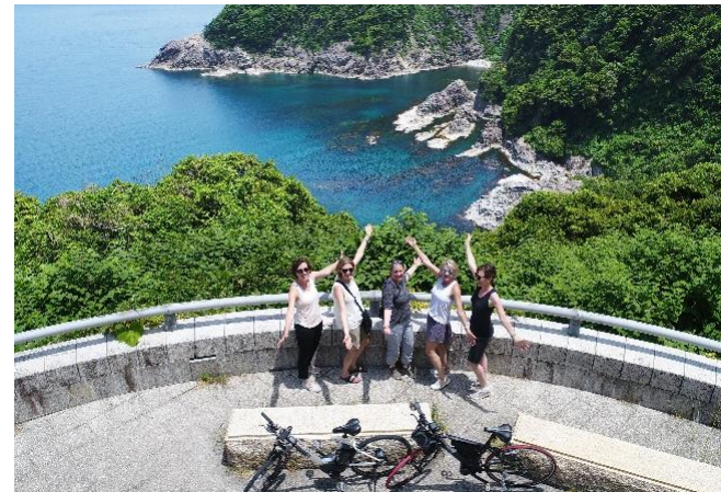
伊根町 蒲入 甲崎展望台