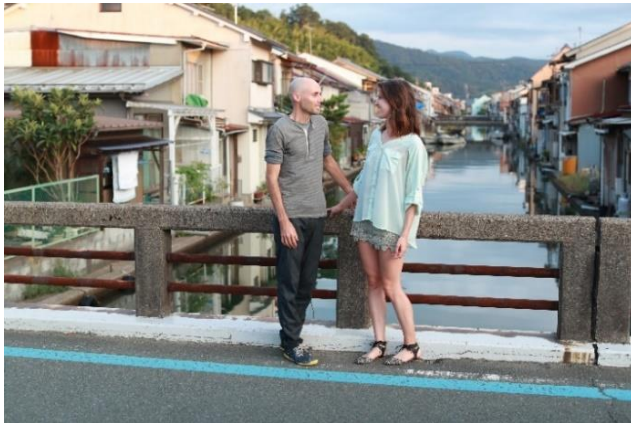
西舞鶴 吉原の入江