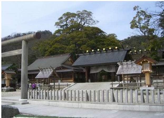
宮津市 元伊勢籠神社

そのため海の京都DMOにおいては、グローバルな観光地経営を戦略的に推進する組織として観光産業事業者や行政とともに、広域連携による滞在周遊型の観光を目指し、交流人口の拡大と地域消費の増加に取り組んでいくこととする。