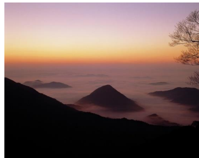
福知山市 大江山雲海