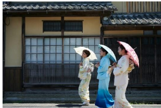
与謝野町 ちりめん街道