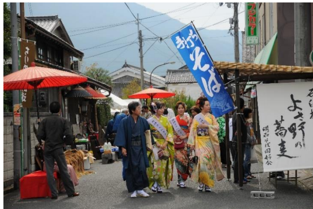
与謝野町 丹後ちりめん街道 着物まつり

今後、本観光圏域では受入環境整備として地域消費を増加させる「地域が稼ぐ」仕組みづくりに取り組むことが大切であり、とりわけ消費額の高いインバウンドでの取り組みが重要と考える。魅力的な観光資源も多くあることから長期間の滞在、エリア内の周遊、再来訪の促進に値する魅力ある観光コンテンツをそれぞれの地域においてブラッシュアップを行い、地域のブランディングを進めるとともに、地域消費の拡大に取り組んでいきたいと考えている。