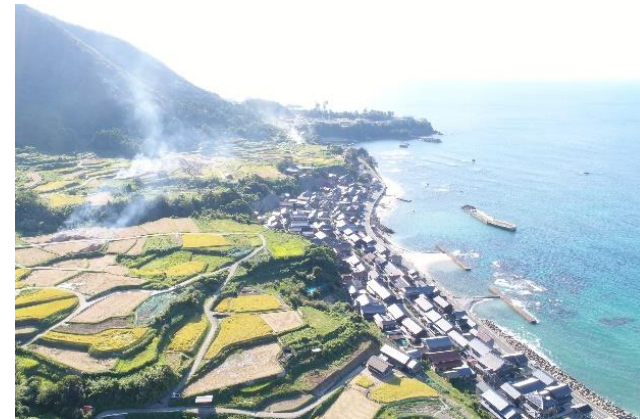
京丹後市丹後町 袖志の棚田