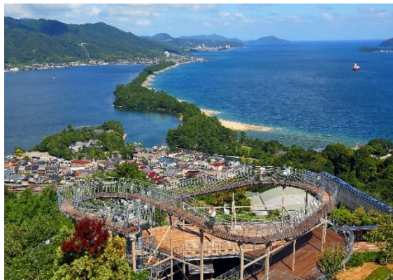
宮津市 天橋立ビューランド

行政職員の人事異動による業務の停滞を防ぎ、将来にわたリインバウンドを含む観光地域づくりを担う人材をDMOで養成、確保。