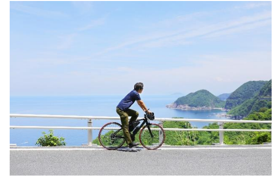
伊根町 丹後半島サイクリング