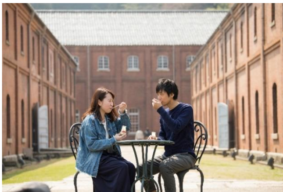
舞鶴赤れんがパーク